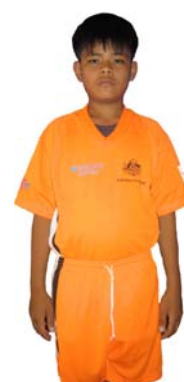
The Seaside SCV Martin Cubbon