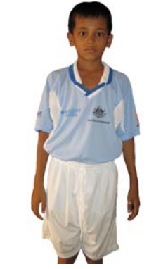
Tonle Sap Teddy Bears Tschrey BB The Rangers Supporters Club: Hong Kong