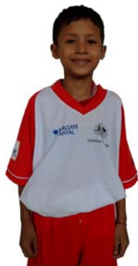
Malu Lions Sunshine Centre for Children Le