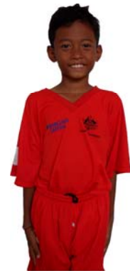
Mekong Rangers HAGAR CLC Boys