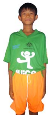
Juice Master United CCOLT Juice Master