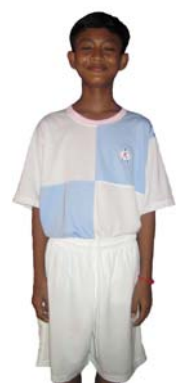
Dunbar Rovers Komar Rikreay BB Dunbar Rovers FC