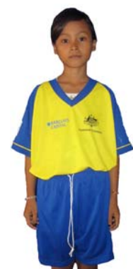
The Tynesiders CCF Cobalt