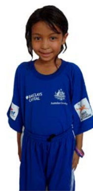
The Cavalry KCD The Cavalry