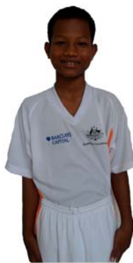
The Flying Tigers ISF School ISF