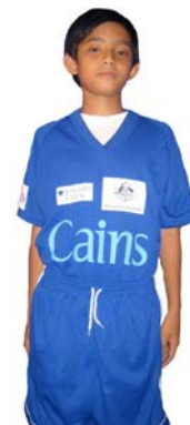
Cains Advocates EYC Cains