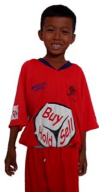
FABBAstigers FEDA FABBAst