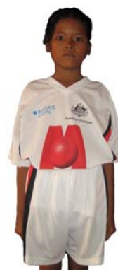
MJB Team PSE Maruhan Japan Bank