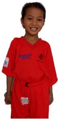
ANDC A New Day Cambodia Chris Power