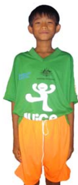
Juice Master United CCOLT Juice Master