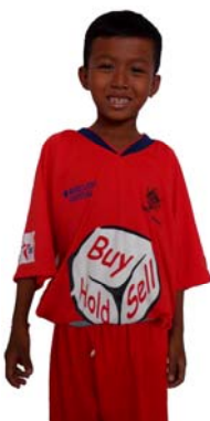
FABBAsTigers FEDA FABBAs