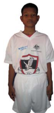
The Dubai Exiles SCV Kandal The Dubai Exiles