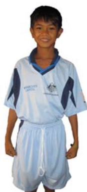
The Blue Eagles ISF Andong Stuart Davy