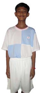
Dunbar Rovers Komar Rikreay BB Dunbar Rovers FC