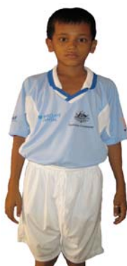
Tonle Sap Teddy Bears Tschrey BB The Rangers Supporters Club: Hong Kong