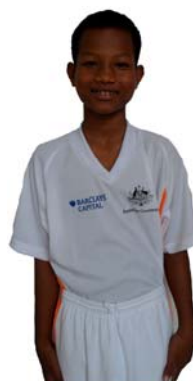
The Flying Tigers ISF School ISF