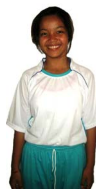
G Girls Rapha House BB Staff of UWCSEA East Campus